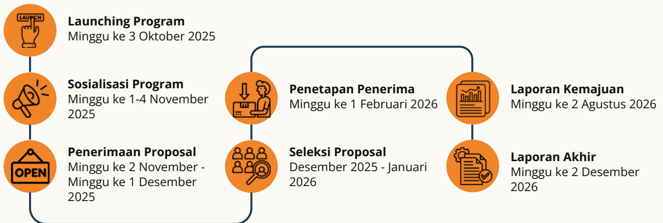
Gambar 4.1 Linimasa Program

Secara umum, tahapan pengusulan meliputi: (a) launching, (b) sosialisasi, (c) penerimaan, (d) seleksi, (e) penetapan, (f) laporan kemajuan dan (g) laporan akhir dapat dilihat di Gambar 4.1.