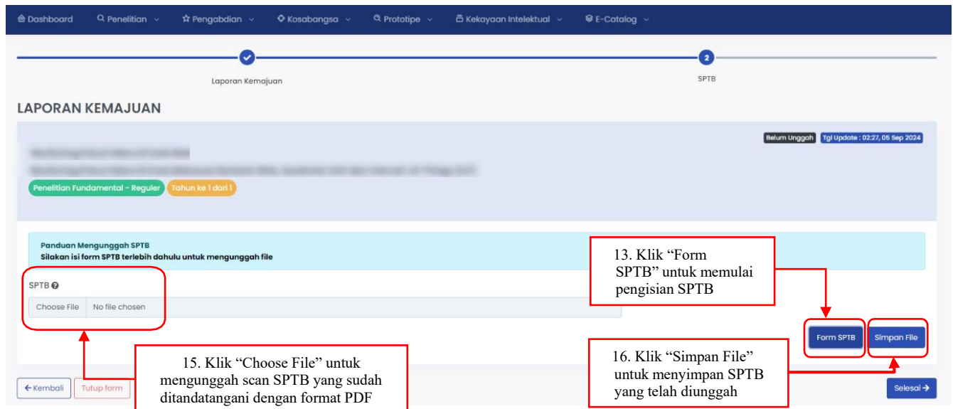
Gambar 6. Menu Surat Pertanggungjawaban Belanja 80%