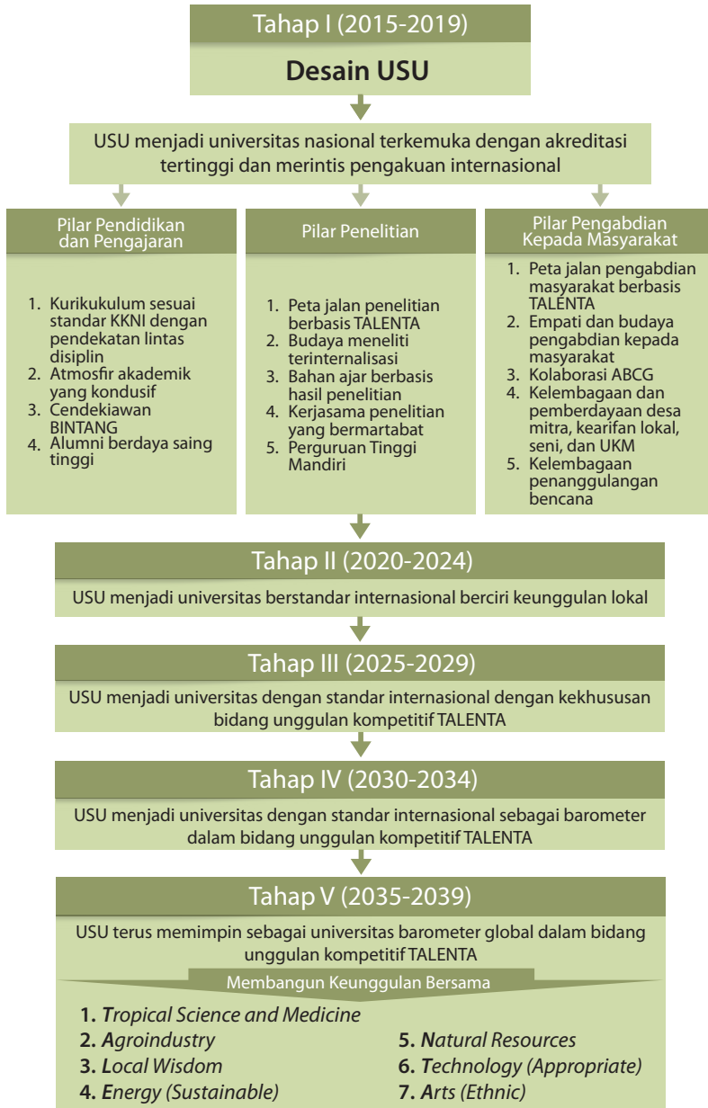
Gambar 2.1 Desain USU 2015-2019