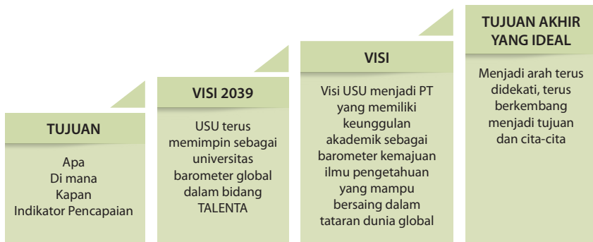
Gambar 1.1 Skema Ends Planning USU

Berdasarkan hasil analisis yang dilakukan maka Desain USU 2039 ditetapkan bahwa Tropical Science and Medicine, Agroindustry, Local Wisdom, Energy (sustainable), Natural Resources (biodiversity, forest, marine, mine, tourism), Technology (appropriate) dan Arts (ethnic) , disingkat TALENTA, sebagai bidang unggulan kompetitif yang dimiliki hanya oleh USU. Seluruh sivitas akademika dan tenaga kependidikan harus memiliki komitmen untuk mewujudkan bidang unggulan kompetitif TALENTA tersebut melalui kegiatan Tri Dharma Perguruan Tinggi yang mencakup pendidikan dan pengajaran, penelitian, dan pengabdian pada masyarakat. Sedangkan tata nilai utama yang disepakati untuk mengarahkan dan menggerakkan perilaku seluruh sivitas akademika dan tenaga kependidikan adalah Bertakwa kepada Tuhan Yang Maha Esa dalam bingkai kebhinekaan, Inovatif yang berintegritas, Tangguh dan arif disingkat BINTANG. Singkatnya, seluruh proses dapat dilihat pada ends planning pada Gambar 1.1: