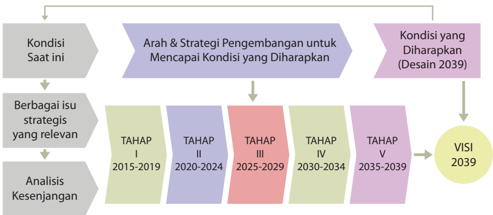
Gambar 5.1 Tahapan Mencapai Visi

Disadari bahwa perubahan USU menjadi knowledge server merupakan pekerjaan berat yang harus dilaksanakan dengan sangat serius dan dengan penuh komitmen. Masih banyak hal yang tertinggal yang harus segera dibenahi terlebih dahulu untuk dapat bergerak menuju sebuah universitas yang akan menjadi barometer global di bidang unggulan kompetitif TALENTA. USU harus memiliki berbagai strategi untuk mengembangkan diri dalam rangka mencapai Desain USU 2039 sehingga mampu menghadapi berbagai tantangan, peluang, dan ancaman dari berbagai situasi lingkungan eksternal, terutama dari berbagai PT luar negeri yang jauh lebih maju. Dengan melakukan perubahan dan perbaikan secara sistematis, disiplin, dan dengan komitmen yang tinggi, USU mampu menempatkan diri di kancah nasional maupun internasional dengan menjadi barometer dalam berbagai bidang studi unggulan, utamanya bidang unggulan kompetitif TALENTA. Tahapan proses mencapai Desain USU 2039 ditunjukkan pada Gambar 5.1: