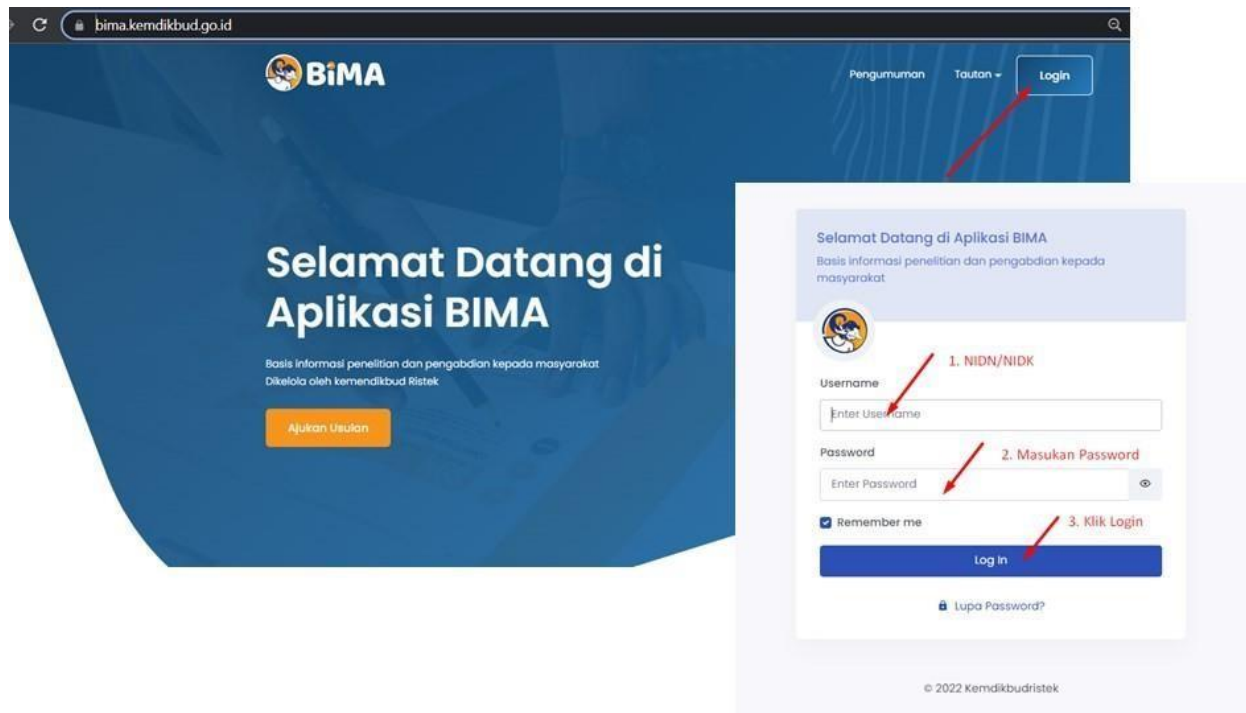
Gambar 1. Beranda akses memasuki aplikasi BIMA

Penerima pendanaan penelitian dan pengabdian kepada masyarakat di Perguruan Tinggi Penyelenggara Pendidikan Akademik Tahun Anggaran 2024, wajib melakukan revisi proposal, rencana anggaran biaya (RAB), dan mengunggah surat pernyataan kesanggupan pelaksanaan melalui aplikasi BIMA pada laman http://bima.kemdikbud.go.id/ dengan menggunakan akun ketua pengusul masing-masing, sebagaimana diperlihatkan pada Gambar 1.