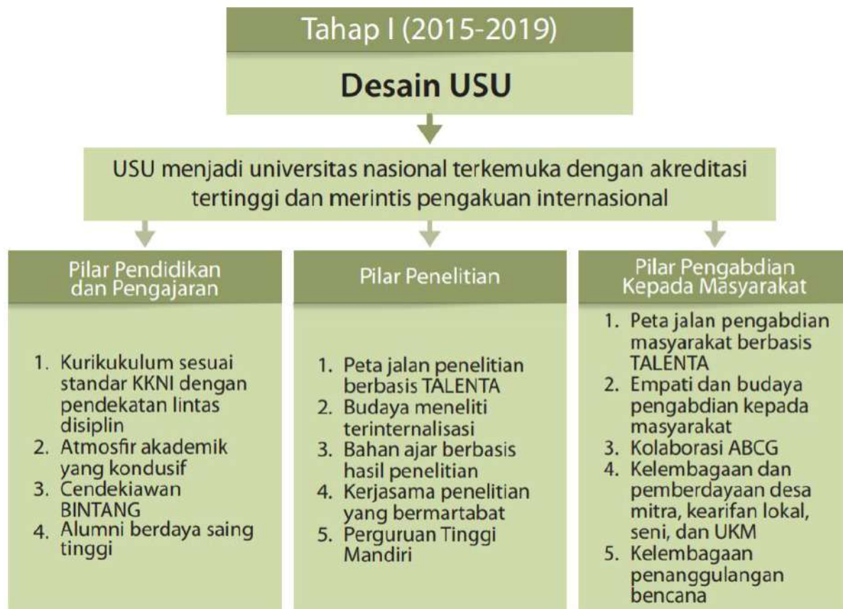
Gambar 2. Desain USU Tahap I (2015-2019)

Desain USU pada tahap lima tahun pertama (2015-2019) yang menjadi arah pengembangan USU selama periode tersebut dapat dilihat pada Gambar 2. Desain ini telah disepakati bersama melalui rumusan desain ideal masa depan USU ( idealized design ) dengan melibatkan pemangku kepentingan (MWA, SA, DGB, eksekutif, dosen, mahasiswa, tenaga kependidikan, alumni, dan beberapa pemangku kepentingan eksternal). Desain ini juga telah mempertimbangkan posisi USU saat ini melalui analisis sistem, analisis peluang dan tantangan pengembangan USU, dan melihat melalui skenario acuan. Desain USU 2015-2019 untuk menjadikan USU sebagai universitas nasional terkemuka dengan akreditasi nasional tertinggi dititikberatkan pada 3 (tiga) pilar Tridharma Perguruan Tinggi dengan capaian sebagaimana disajikan pada Gambar 2. Indikator pencapaian telah ditetapkan dalam Renstra USU untuk mencapai tujuan yang melekat pada Desain USU 2015-2019 seperti tercantum pada Tabel 1.