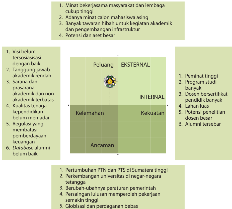
Gambar 3.1 Matriks Pemosisian USU

Kondisi USU yang berada pada posisi kuadran 3 menunjukkan bahwa USU memiliki peluang untuk menjadi universitas terkemuka nasional dengan akreditasi tertinggi dan menjadi universitas berstandar internasional. Akan tetapi, di lain pihak USU menghadapi beberapa kendala dan memiliki kelemahan internal. Titik berat strategi untuk USU adalah melakukan upaya meminimalkan masalah-masalah internal melalui konsolidasi dan pemahaman yang sama terhadap visi dan misi USU sehingga dapat merebut peluang yang lebih baik.