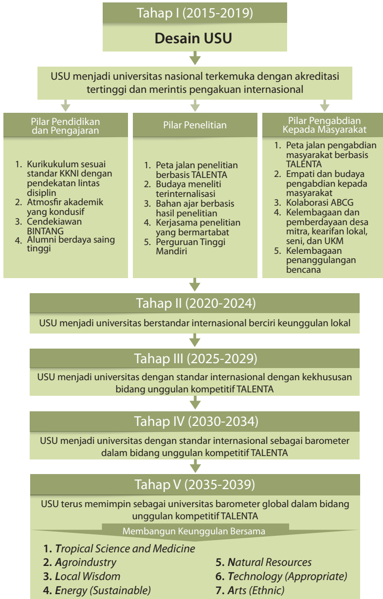
Gambar 2.1 Desain USU 2015-2019