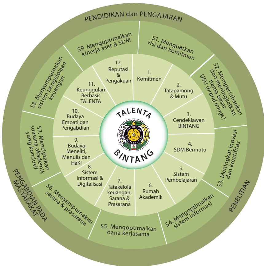
Gambar 4.1 Sinergisitas Tri Dharma Perguruan Tinggi, strategi dan program kerja dengan menginternalisasi tata nilai utama BINTANG untuk mencapai keunggulan bersaing TALENTA