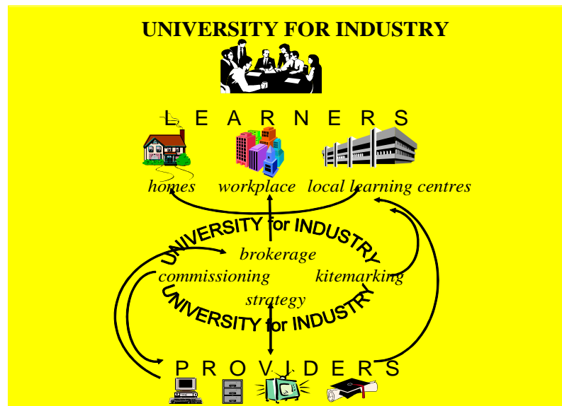
Gambar-2. University for Industry

Untuk mewujudkan diri sebagai University for Industry , USU perlu segera membenahi seluruh proses dan mengemas produk-produknya dalam bidang pendidikan, penelitian dan pengabdian kepada masyarakat agar mampu mengikuti perkembangan kebutuhan masyarakat yang semakin bersaing secara global. Para pakar (tenaga pendidik) harus terampil dalam mengemas bidang-bidang ilmu keunggulannya masing-masing kedalam bentuk yang mudah dicerna dan dimanfaatkan oleh para pembelajar khususnya pembelajar non-formal serta dapat diakses dengan mudah melalui media Information Communication Technology (ICT). Pelayanan bagi kelompok pembelajar formal ( formal students ) perlu lebih diarahkan kepada pembentukan lulusan berdaya saing global yang memiliki kemampuan tinggi tidak hanya dalam bidang keilmuan tetapi juga keterampilan komunikasi termasuk dalam penggunaan teknologi komunikasi. Hal ini sangat penting karena pasar kerja akan membutuhkan tenaga-tenaga kerja yang memiliki keterampilan mengkomunikasikan ilmu dan hasil-hasil penelitiannya dengan pemanfaatan teknologi informasi dan komunikasi.